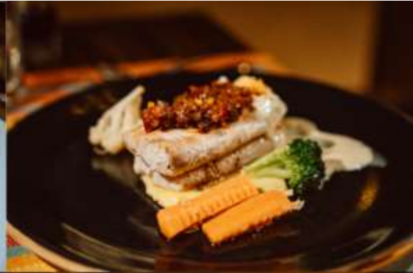
เสิร์ฟอาหารแบบ Fine Dining 3-4 Course