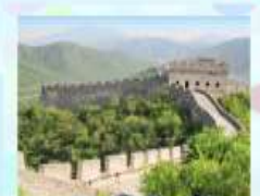
ตลาดร้อยปีเฉิงหวงเมี่ยว กำแพงเมืองจีน ด้านจี้ยงกวน