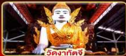
วัดงาทัดจี

สักการะ 3 มหาบุชาสถาน พักบนอินทร์แวน 1 คืน