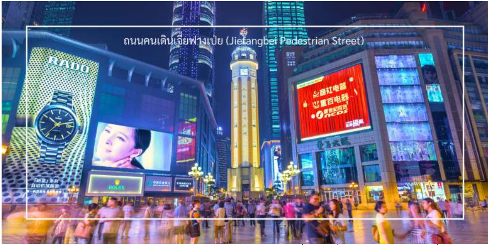
ถนนคนเดินเจี๋ยฟางเป่ย์ (Jiefangbei Pedestrian Street)

นำท่านชม ตึกไควชิงโหล (Kuaiqinglou) ตึกสุดแปลก เดินทางจากชั้น 1 เป็นชั้นที่ 22 แลนด์มาร์กสำคัญที่ตั้งตระหง่านอยู่ใจกลางเมืองฉงชิ่ง โดดเด่นด้วยสถาปัตยกรรมสูงสง่าที่ผสมผสานความทันสมัยเข้ากับเสน่ห์ของวัฒนธรรมท้องถิ่นอย่างลงตัว จากชั้นบนสุดของตึกสูง 22 ชั้นแห่งนี้ ท่านจะได้สัมผัสกับทัศนียภาพสุดตระการตาแบบพาโนรามา 360 องศา ทั้งแม่น้ำแยงซีที่ทอดยาวคดโค้งไปท่ามกลางภูเขาสูง และภาพเมืองฉงชิ่ง