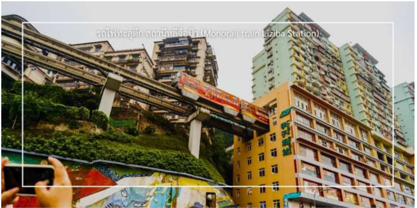
รถไฟเหาะลัดถ้ำ สถานีหลี่จื่อปา (Monorail train Liziba Station)

นำท่านสู่ เมืองโบราณสีอปาตี (Shibati Ancient Town) ตั้งอยู่ในเขตฉงชิ่ง (Chongqing) เป็นเมืองโบราณที่มีเสน่ห์ และเต็มไปด้วยประวัติศาสตร์ อดีตของเมืองนี้ย้อนกลับไปหลายร้อยปี และมีการอนุรักษ์สถาปัตยกรรมแบบดั้งเดิมไว้ อย่างดี เมืองนี้มีบ้านเรือนและอาคารที่สร้างขึ้นในสไตล์จีนโบราณ ซึ่งมีลักษณะเฉพาะที่สะท้อนถึงวัฒนธรรมและ ประเพณีท้องถิ่น และยังมี ถนนในเมืองโบราณสีอปาตีที่มีความคดเคี้ยวและเต็มไปด้วยร้านค้า ร้านอาหาร และคาเฟ่ที่ขาย สินค้าท้องถิ่น