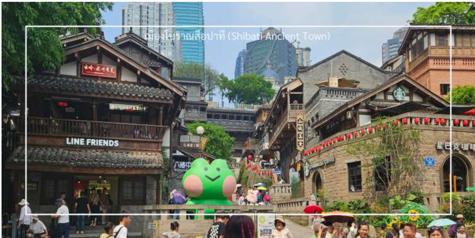
เมืองโบราณสีอปาตี (Shibati Ancient Town)

นำท่านสู่ เมืองโบราณสีอปาตี (Shibati Ancient Town) ตั้งอยู่ในเขตฉงชิ่ง (Chongqing) เป็นเมืองโบราณที่มีเสน่ห์ และเต็มไปด้วยประวัติศาสตร์ อดีตของเมืองนี้ย้อนกลับไปหลายร้อยปี และมีการอนุรักษ์สถาปัตยกรรมแบบดั้งเดิมไว้ อย่างดี เมืองนี้มีบ้านเรือนและอาคารที่สร้างขึ้นในสไตล์จีนโบราณ ซึ่งมีลักษณะเฉพาะที่สะท้อนถึงวัฒนธรรมและ ประเพณีท้องถิ่น และยังมี ถนนในเมืองโบราณสีอปาตีที่มีความคดเคี้ยวและเต็มไปด้วยร้านค้า ร้านอาหาร และคาเฟ่ที่ขาย สินค้าท้องถิ่น