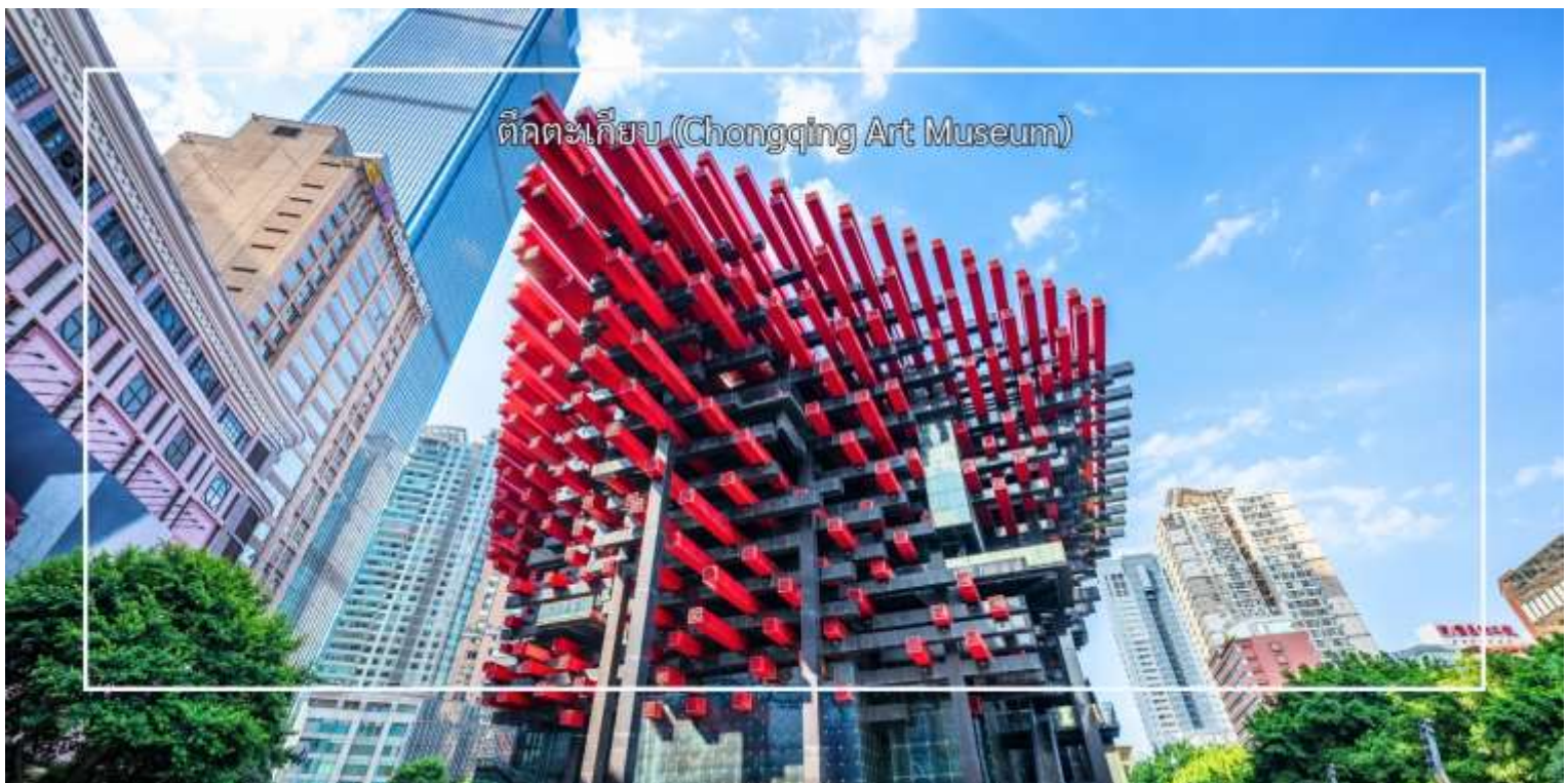
ตึกตะเกียบ (Chongqing Art Museum)

นำท่านสัมผัสความสวยงามของ ตึกตะเกียบ (Chongqing Art Museum) แลนด์มาร์คสุดแปลกตาใจกลางเมือง ที่ออกแบบอาคารให้มีลักษณะคล้ายตะเกียบยักษ์สีแดง-ดำซ้อนกันอย่างโดดเด่น อาคารแห่งนี้เป็นที่ศูนย์จัดแสดงศิลปะร่วมสมัยและจุดถ่ายภาพยอดนิยมของนักท่องเที่ยว ด้วยดีไซน์ทันสมัยและเอกลักษณ์เฉพาะตัว ทำให้ที่นี่กลายเป็นหนึ่งในสถานที่ที่ต้องมาเยือน