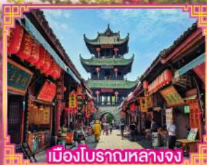
เมืองโบราณหลวงจง