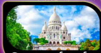
วิหารสกรเทอร์ มงมาร์ต