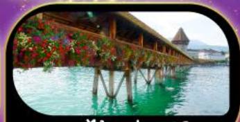
สะพานไม้ฆาปค ลูซิริน