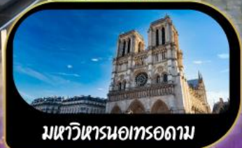
มหาวิหารนอทรอดาม