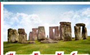
เยือนสโตนเฮนจ์ และ พิพิธภัณฑน์โรมันบาร