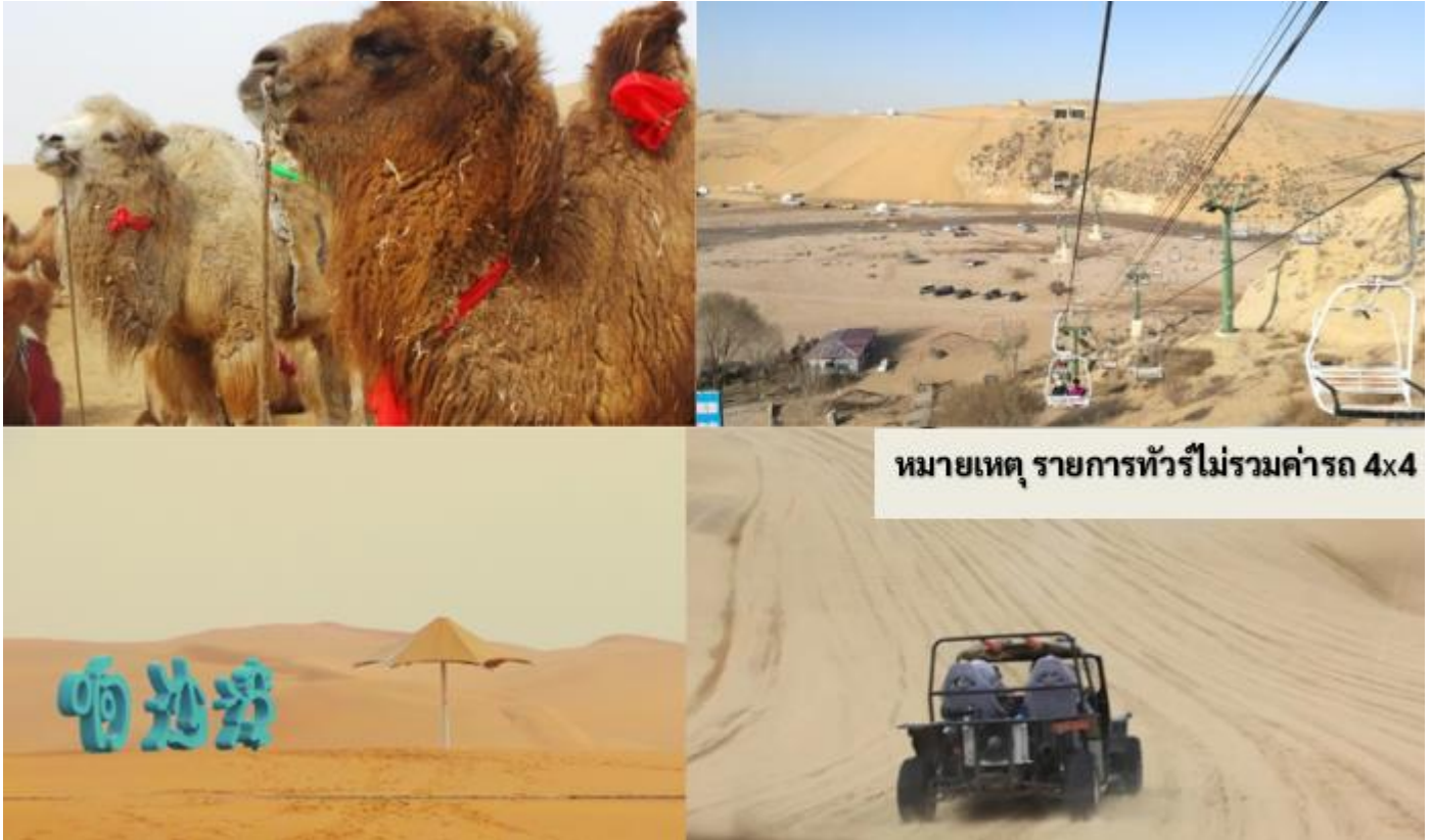
หมายเหตุ รายการทัวร์ไม่รวมค่ารถ 4x4

บริษัทฯ จึงไม่สามารถคืนค่าใช้จ่ายในส่วนนี้ได้ และต้องขอภัยในความไม่สะดวกมา ณ ที่นี้ และหวังเป็นอย่างยิ่งว่า ท่านจะเข้าใจในมาตรการเพื่อความปลอดภัยดังกล่าว