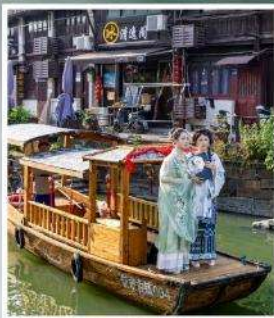
เมืองโบราณ จีนชื่องูเจิน