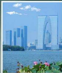
SUZHOU EAST GATE