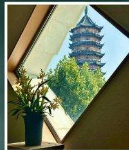
วัดเจดีย์เป่ย์ถ่า