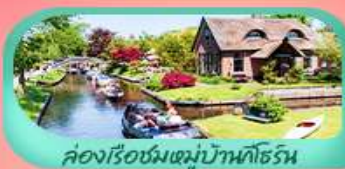
คลองเรือชมหมู่บ้านทอร์น