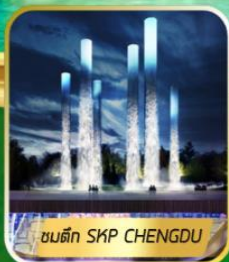
ชนตึก SKP CHENGDU