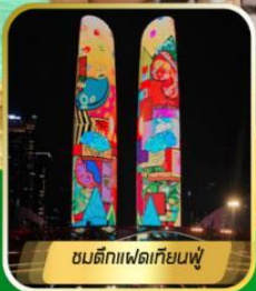
ชนตึกเฟดเทียนฟู