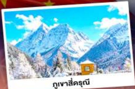
ภูเขาสีครุณี

เที่ยว 3 อุทยานสวรรค์แห่งมณฑลเสฉวน ถ่ายรูปเช็คอินน้ำพุไม่ไผ่ยักษ์ เดินเล่นถนนโบราณ