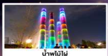
น้ำพุไม่ไผ่