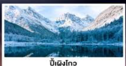
บี้ผิงโกว