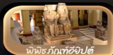
พีพีร์กัณฑ์ฮียิปต์