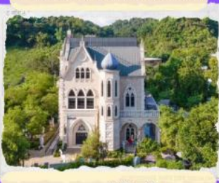
ทะเลสาบสุริยขึ้นจันทรา