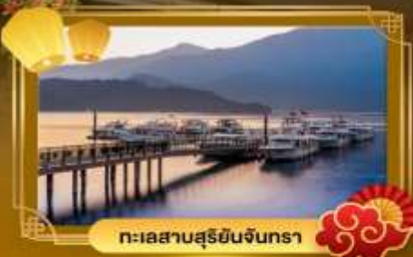
ทะเลสาบสุริยจันทร์