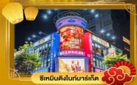
ช้อปปิ้งในทงมาร์เก็ต