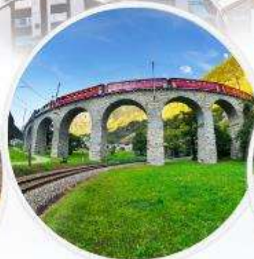
Bernina Express รถไฟสายโรแมนติก เส้นทางมรดกโลก