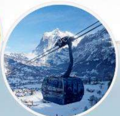
Eiger Express กระเช้าชมวิวขึ้น ยอดเขาจุงเฟรา