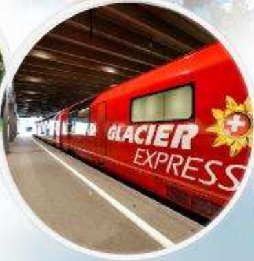
Glacier Express รถไฟชมวิว สวยที่สุดในสวิส