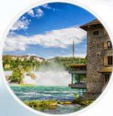
Rhinefall น้ำตกที่ใหญ่ ในยุโรปกลาง