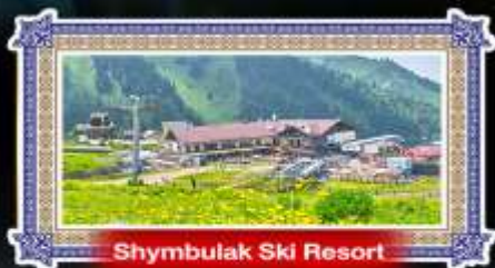
Shymbulak Ski Resort