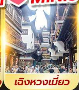
เจียงหวงเมี่ยว