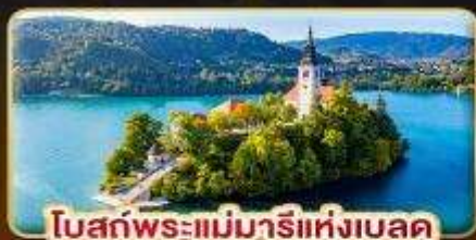
โบสถ์พระแม่มาเรียแห่งเบลด