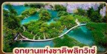
อุทยานแห่งชาติพลิตวิกิ