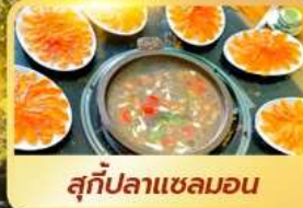
สุกี้ปลาแซลมอน