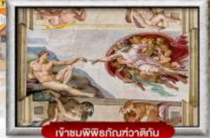
เข้าชมพิพิธภัณฑ์ทวารดิกัน