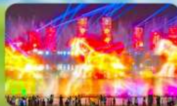
น้ำพุคนตรีคังปาสือ