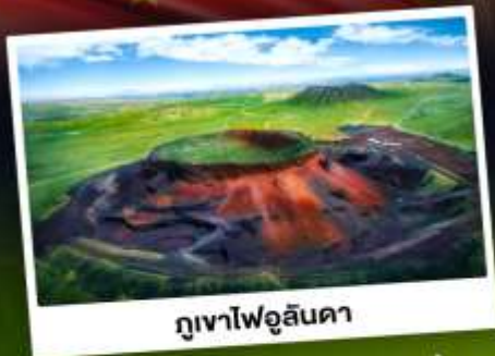
ภูเขาไฟอูลันดา