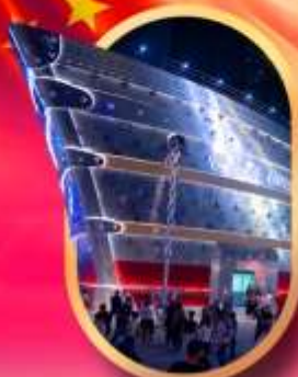
เรือเดอะหลุยส์