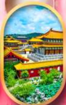
เมืองจำลองสามก๊ก