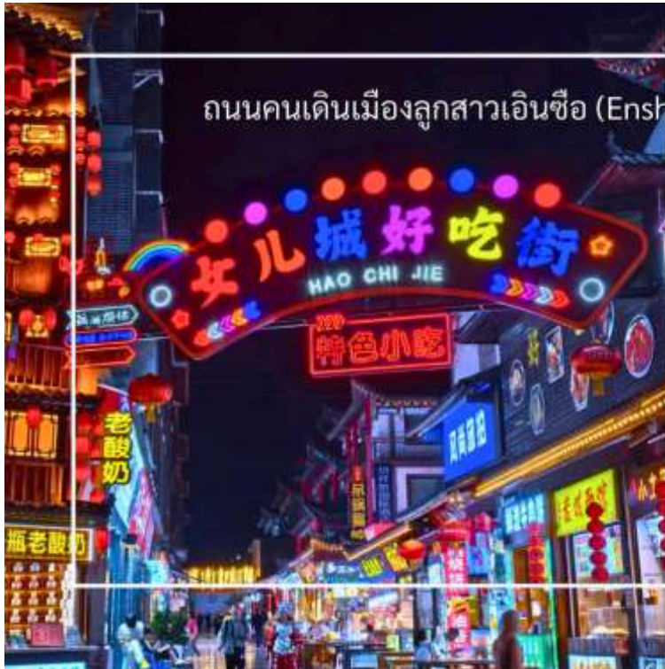
ถนนคนเดินเมืองลูกสาวเินซือ (Enshi Daughter City Pedestrian Street)

สมควรแก่เวลานำท่านสู่ ถนนคนเดินเินซือ (Enshi Daughter City Pedestrian Street) หรือเรียกอีกชื่อ ถนนคนเดินเมืองลูกสาวเินซือ เป็นศูนย์กลางกิจกรรมท้องถิ่นที่เต็มไปด้วยสีสันและวัฒนธรรมของเินซือ ถนนเส้นนี้เต็มไปด้วยร้านค้า ร้านอาหาร และแผงขายสินค้าพื้นเมือง ทั้งของฝาก งานหัตถกรรม และอาหารท้องถิ่น ทำให้นักท่องเที่ยวได้สัมผัสวิถีชีวิตของคนท้องถิ่นอย่างใกล้ชิด บรรยากาศในยามค่ำคืนมีชีวิตชีวา แสงไฟประดับถนนสวยงามตัดกับภูมิทัศน์เมืองเก่า และมีมุมถ่ายภาพสวยๆ ให้ผู้มาเยือนได้เก็บความประทับใจ