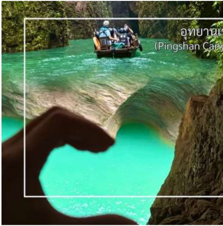
อุทยานเขาผิงซาน (Pingshan Canyon Scenic Area)