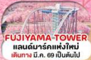
FUJIYAMA-TOWER แลนด์มาร์คแห่งใหม่ เดินทาง มี.ค. 69 เป็นต้นไป