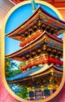
วัดนาริตะ