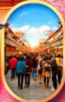
ถนน นากาบิเสะ