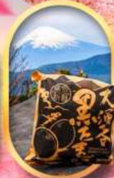
หุบเขาโอวาคุดานิ