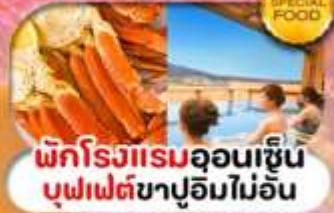
ที่พักโรงแรมออนเซ็น บุฟเฟต์ชาบูอิมโมอัน