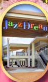
มิตซึเอะฮาร์ท