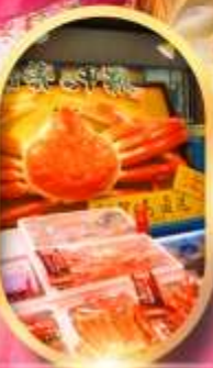
ตลาดปลาเมืองนาระ