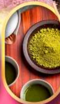
ชงชาแบบญี่ปุ่น