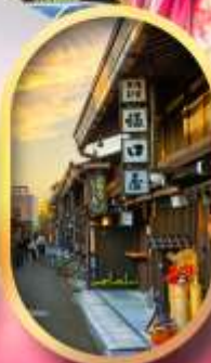
เมืองเก่าทาคายามา