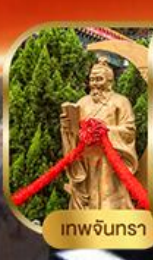
เทพจันทร

พิเศษฟรี! ลงห้องลับหวังต้าเซียน รวมกระเช้าฮ่องกง