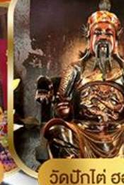
วัดบิกโต ฮองอ่า