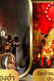
วัดเจ้าแม่กวนอิม ฮองอ่า