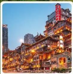
หงหยาดิง