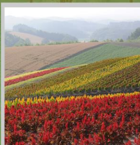
“SHIKISAI NO OKA”