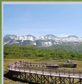
“SHIRETOKO 5 LAKES”