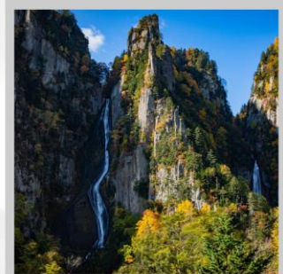
"GINGA & RYUSEI FALLS"

ต้นตอ "ทุ่งดอกพืชมอส ณ สวนดอกชิบะซากุระฮิงะชิโมะโคะโคะ" ด้วยพรมสีชมพูที่มีพื้นที่ขนาดใหญ่ถึง 100,000 ตารางเมตร ชม "ทะเลสาบคาบสมุทรชิเรโตโก" เกิดมาจากการระเบิดของภูเขาไฟโอโอะและน้ำพุใต้ดิน จนเกิดเป็นทะเลสาบทั้ง 5 ของชิเรโตโก "ฟาร์มสุนัขจิ้งจอกฮอกไกโด" ฟาร์มสุนัขจิ้งจอกแห่งเดียวของเกาะฮอกไกโด สายพันธุ์ท้องถิ่นคือ สายพันธุ์ Ezo red fox เพลิดเพลินกับ "เนินสีฤดู" เนินเขากว้างใหญ่ที่มีดอกไม้ไม้บานาพันธุ์นับ 30 ชนิดปลูกเรียงรายสลับสีกันเป็นแนวยาว นำท่าน "นั่งกระเช้าภูเขาคุโรดะเคะ" เชื่อมจากเชิงเขาของเมืองโซอุนเคียวถึงยอดเขาคุโรดะเคะเคะที่มีความสูงถึง 670 เมตร ไฮไลท์ "ส่องเรือราอูสี ชมความงามของวาฬเพชรฆาต" บริเวณคาบสมุทรชิเรโตโก มรดกโลกทางธรรมชาติของฮอกไกโด