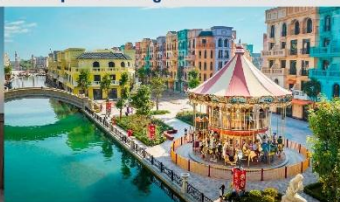
Mega Grand World