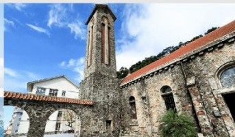
โบสถ์หินตามด้าว