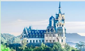
ปราสาทตามด้าว