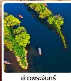
อ่าวพระจันทร์