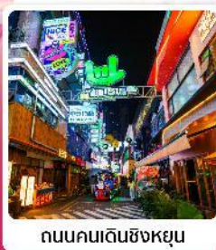
ถนนคนเดินซิงหยุน

• โฮเทล ส่วนชาคุระผิงปา หนึ่งในสถานที่ชมดอกชาคุระที่ใหญ่ที่สุดในโลก นำटकสอยระดับ 5A น้ำตกหวงกั๋วซู่ หมู่บ้านจีนโบราณ วูเจียงจ้าย