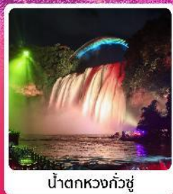
น้ำตกหวงกั๋วซู่