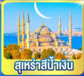
สุเหร่าสีน้ำเงิน