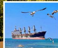
เรือสินค้าเกย์ตันบลูอิส