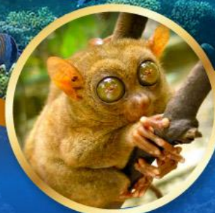
ลิงทาร์เซีย