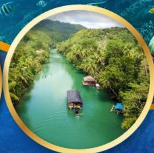
ล่องเรือแม่น้ำโลบ็อก