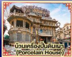
บ้านเครื่องปั้นดินเผา (Porcelain House)