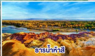
ธารน้ำห้าสี