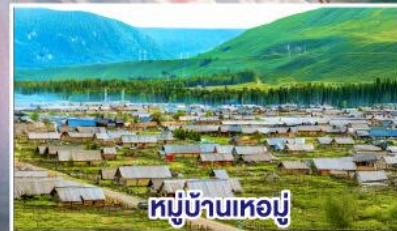
หมู่บ้านหอยมู