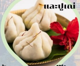
รับชุดสักการะฟรี! ท่านละ 1 ชุด