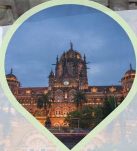
ชม Victoria Terminus สถานีรถไฟประวัติศาสตร์และเป็น มรดกโลกของยูเนสโก