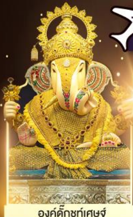
องค์ดีกษุท์พิเศษ