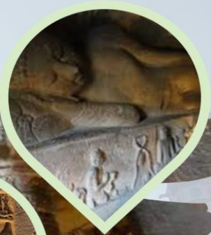
นั่งชมถ้ำพระพุทธศาสนา ถ้ำเอลโลรา