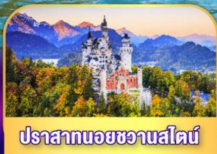
ปราสาทนอยชวานส์ไตน์