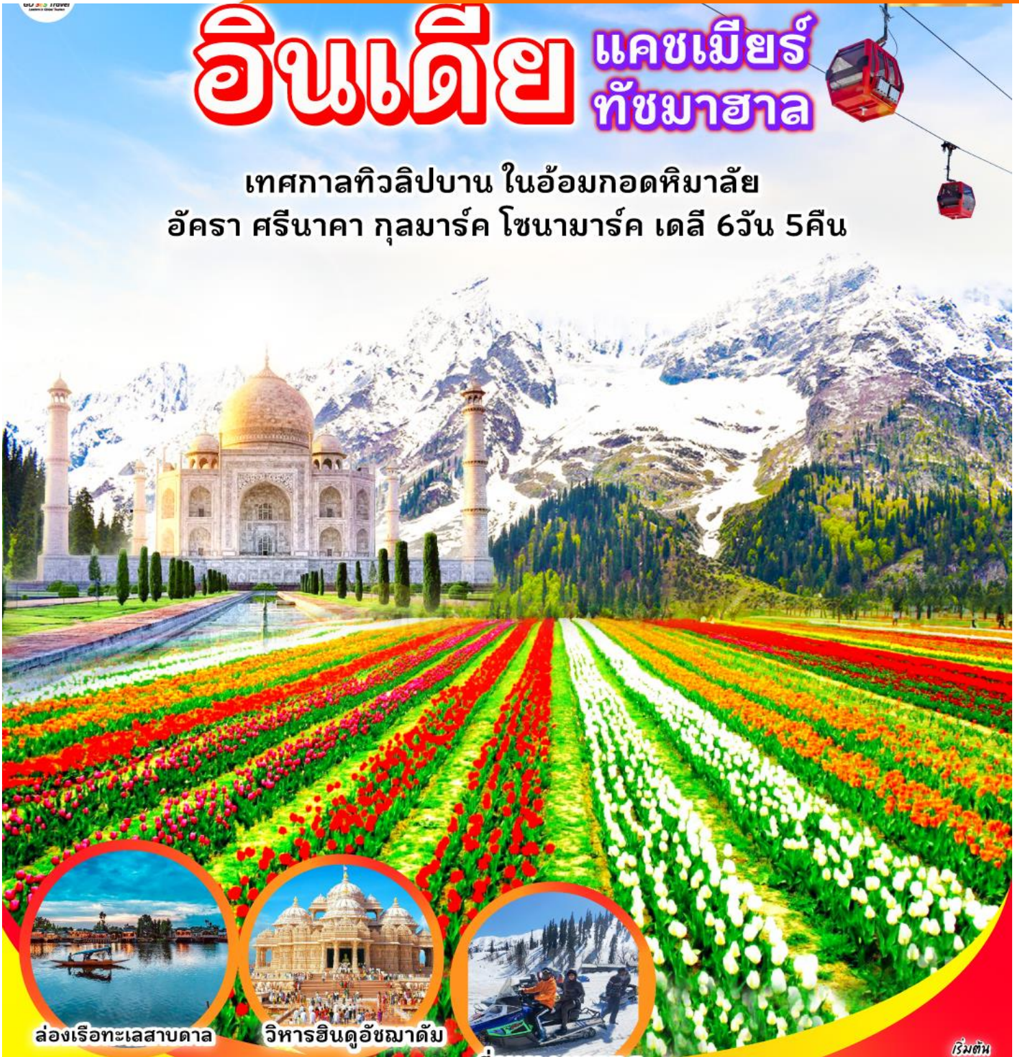
ล่องเรือทะเลสาบดาล

เทศกาลทิวลิปบาน ในอ้อมกอดหิมาล้ำ อัครา ศรีนาคา กุลมาร์ค โซนามาร์ค เดลี 6วัน 5คืน