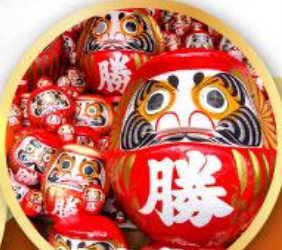
วัดคัตสึโงอิ (วัดดามะ)

ชมความงามของกำแพงหิมะ เส้นทางสายอัลไพน์ ทากายามา (JAPAN ALPS SNOW WALL)