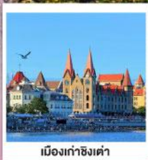
เมืองท่าชิงเต่า