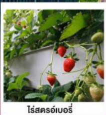
โรสครอ์เบอร์รี่