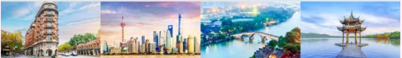
ถนนอู๋คัง