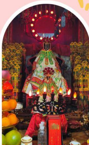
วัดเจ้าแม่กวนอิมฮ่องฮำ

ความสำเร็จ ความมั่งคั่ง เงินทองไหลมาเทมา