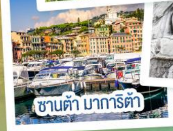
ซานต้า มารีอา