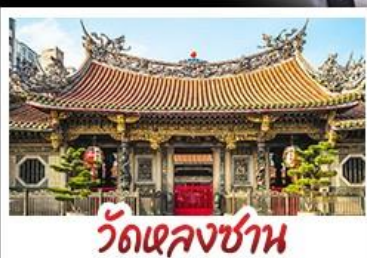
วัดเจหลงซาน