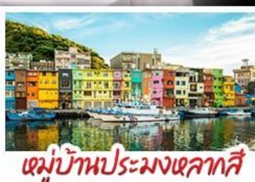
หมู่บ้านประมงเหลากสี