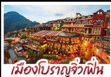
เมืองโบราณจิวเฟิน

เที่ยวธรรมชาติระดับโลก เอเชีย ทะเลสาบสุริยันจันทรา - เมืองดงครก ไทเป จิวเฟิน - ซีเหมินติง