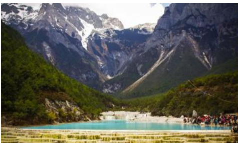
อุทยานไป๋สู่ยเหอ (หุบเขาพระจันทร์สีน้ำเงิน)

หมายเหตุ กรณีที่กระเช้าขึ้นภูเขาหิมะมังกรหยกปิดให้บริการ ด้วยเหตุที่สภาพอากาศไม่เอื้ออำนวย หรือเป็นการปิดเพื่อตรวจสอบสภาพและซ่อมแซมประจำปี ทางทัวร์ขอสงวนสิทธิ์ที่จะจัดโปรแกรมขึ้นกระเช้า ที่จุดชมวิวภูเขาหิมะมังกรหยก ณ สถานีกระเช้าหุยนซานผิงแทน