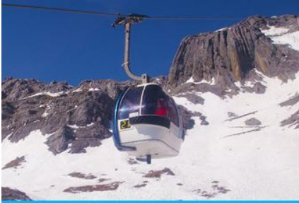
ภูเขาหิมะมังกรหยก (น้ำกระช้ำใหญ่)