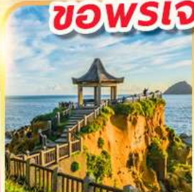
เกาะเหอผิง

พักย่านซีเหมินติง 2 คืน ขอพรเจ้าแม่กวนอิมพันมือ