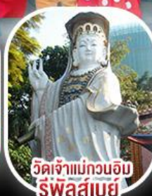
วัดเจ้าแม่กวนอิม ริฟลส์เบย์