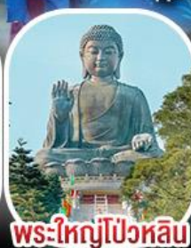
พระใหญ่โป่วหลิน